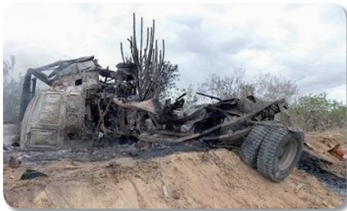
Um motorista morreu após a carreta em que dirigia, com placa de Betim, tombar e pegar fogo na BR 116

Para o Sindtaque, cada qual deve fazer sua parte: os governantes devem manter as rodovias em condições adequadas e intensificar a fiscalização para que não haja abusos no limite de velocidade. As distribuidoras devem oferecer condições dignas de trabalho e fretes justos aos transportadores. Já os transportadores devem obedecer as leis de trânsito e a legislação referente ao transporte de cargas perigosas.