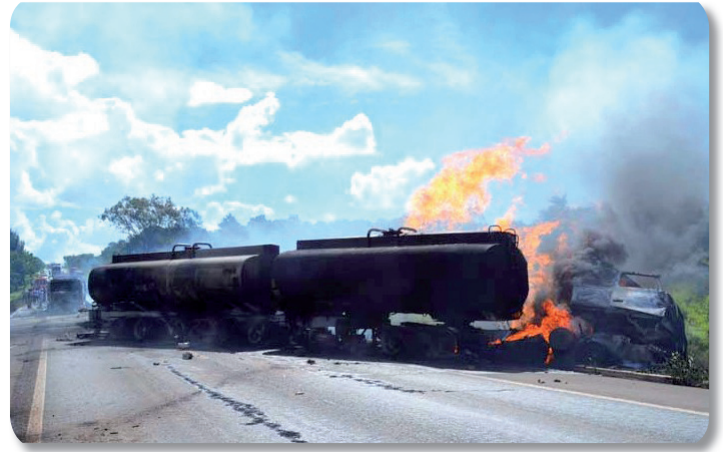
Grave acidente na BR 365, que envolveu duas carretas tanque, resultou em três mortes e três feridos

Mas, por que tantos acidentes estão ocorrendo nas estradas? A falta de estrutura das rodovias, como asfalto e sinalização precários, o transporte irregular de combustíveis e a imprudência, representada por atitudes como excesso de velocidade e ultrapassagem perigosa, sobretudo quando os veículos transportam cargas explosivas e perigosas, como combustíveis, são apontadas como algumas das principais causas do