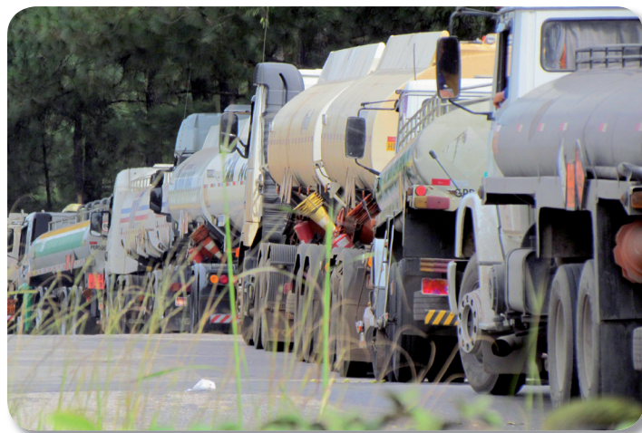
ICMS do diesel, taxas e impostos têm complicado a situação dos transportadores de combustíveis de Minas

de governo em Minas, esperamos que o novo governador, Alberto Pinto Coelho Júnior, dê maior atenção aos transportadores. Nos últimos anos, fomos sempre bem recebidos na Cidade Administrativa, mas precisamos