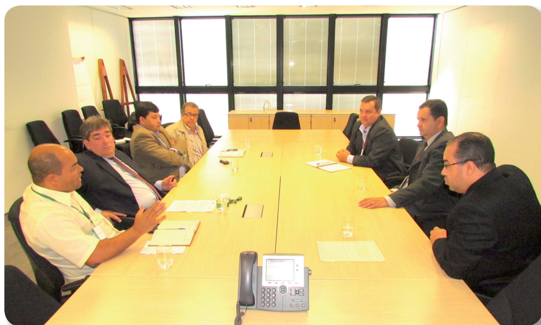
O governo confirmou a isenção do pagamento do ICMS sobre o transporte interestadual de produtos perigosos e o aumento da validade da nota fiscal do transporte para 48h

Para a direção do Sindtaque, as medidas, que entraram em vigor no dia 1º de julho, são importantes e significam um avanço nas negociações com o governo estadual, que se arrastam há mais de um ano e meio. No entanto, não solucionam o drama vivido pelos transportadores de Minas, que têm amargado sérios prejuízos desde que o ICMS do diesel passou de 12% para 15% no Estado, em