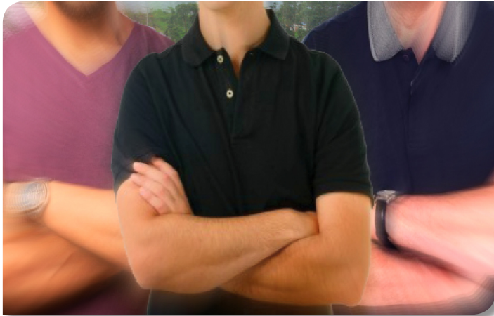
Estado de greve, iniciado em 3 de setembro, continua até que as distribuidoras passem a cumprir a tabela do frete

Os transportadores de combustíveis e de derivados de petróleo de Minas Gerais estão em “estado de greve” desde o dia 3 de setembro, em protesto contra o descumprimento da Lei 13.703/2018, que instituiu a Política Nacional de Pisos Mínimos do Transporte Rodoviário de